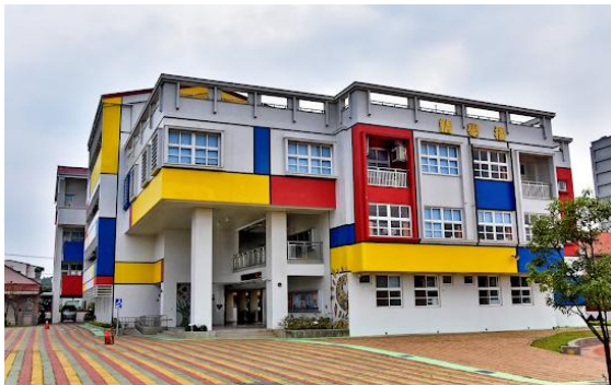
図7 精忠小 カラフルなデザインが特徴 この学校ともずっと TBP を行っている、学年 2 クラス嘉儀市では小規模な学校ではあるが、毎回歓待してくれる。この学校の 5, 6 年の 4 クラスと交流を行っている。