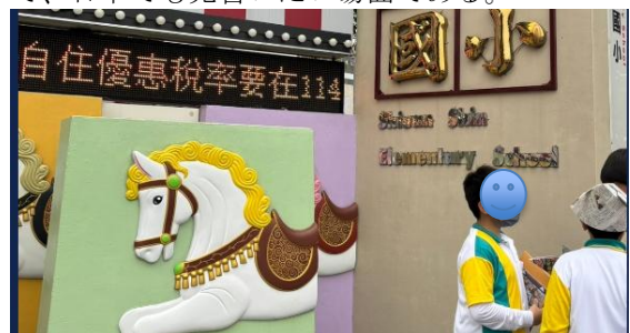
図11 英語でモニュメントの前で説明する児童 ○第4校目 高雄市新甲小学校（1月3日）

児童が日本の学生に対して英語で学校の周囲にあるモニュメントの説明を行った。この学校は昔の競馬場の跡地にあり、馬に関するモニュメントが残されている。地域とのつながりを児童が説明できるようにしていることは、地域を愛する心を育てる上で重要であり、英語で説明することで外国の訪問客へのアピールになるので、日本でも見習いたい場面である。