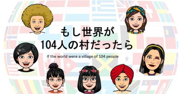
図3 100人村のスライドの一部

校で実施。大学生は、国際状況を学習したうえで、小学生に訴えたいものを決め、いろいろな国の服装を身につけて、世界の富の偏りや識字率の問題などをクイズ形式でおこなった。参加する小学生は世界の住民になって指示に従って動く体験型のワークショップである。