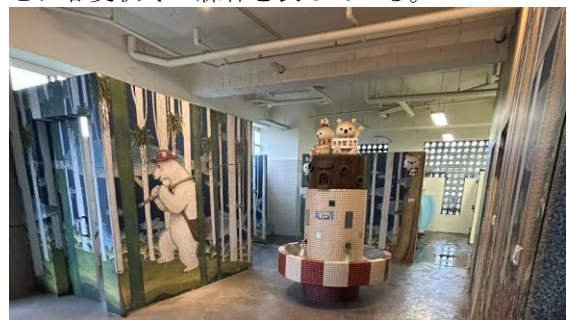
図10 白熊の絵のあるトイレ