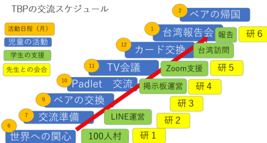
図2 年間計画の進行図