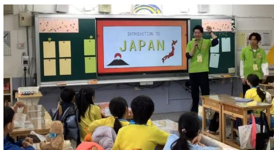
図6 五常小の教室で日本紹介をする学生