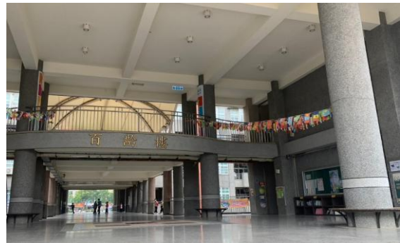
図9 荘厳な宣信小の玄関 この学校は白熊をモチーフとした有名なイラストレータ「莊信棠」（SMART）を輩出した学校で、学校の中にも「沉睡大白熊」をモチーフにしたデザインされたトイレがあり、各階ごとに春夏秋冬の森林を表している。