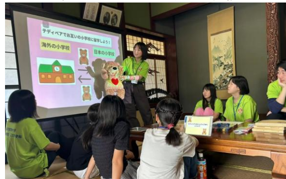
図4 志賀町でのワークショップの開催

小学校単位で行うのではなく、国際協働学習やICTに興味のある地域の児童を集め、現地の組織「くまの地域づくり協議会」との共催で年3回のワークショップ（TBP及び小学校英語）を計画。（残念ながら3回目は大雪のため中止）