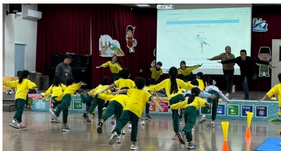
図8 バイリンガル体育の授業 嘉儀市ではバイリンガル教育がされていた。ここでは嘉儀大学の大学院で学んでいる学生が、小学校の体育でヨガを教えていた。指示は英語である。体育は体を動かすので英語の指示が十分わからなくても、まねすることで可能である。嘉儀市では、外国籍の留学生を積極的に活用しており、小学校でバイリンガルの授業に採用しているそうである。いろいろな国の英語を聞かせることで、共通語としての英語の重要性を感じることができる。英語を使ったバイリンガル教育は、体育、音楽、図工などのから 1 科目選んで学校裁量で行っている。学生も体育の授業に混ぜてもらって授業を受けた。指示は英語であるが、体育なのでわかりやすい。 ○第3校目 嘉儀市宣信小学校（1月2日午後）