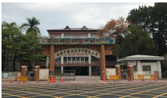
図 12 新甲小学校の門

台湾の南部の高雄市にある小学校、日本だけでなく、いろいろな国と交流をしている。クリスマスの英語のダンスで迎えてくれた。この小学校も毎年温かく迎えてくれる学校である。