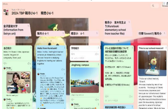
図5 Padletによる交流の様子

LINE は先生同士の連絡に日常的に使って便利であるが、それだけでは児童が相手とつながっている感じを持つことができない。そこで、互いの国の児童同士は、送られたきたテディベアの滞在の様子などを写真にとって交流のために使用した。ここでも大学生が Padlet の管理を行い、メニューやスレッドを立てて、互いの児童の書き込みを支援した。