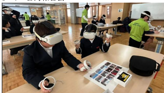
図 13 台湾の 360 度映像を視聴する児童

日本に帰国後、大学生は、台湾の小学校の様子を伝える報告会を行った。大学生は 1 人が 1 つのクラスを担当しており、日本の各クラスで、台湾クイズを実施。昼食後の午睡の話や、給食の内容などについてクイズ形式で報告を行った。また、時間が取れるクラスでは、台湾で撮影してきた 360 度映像を VR ゴーグルで視聴する機会も持った。360 度映像は YouTube にアップしたものを視聴してもらった。交流校の玄関から入っていく動画などを視聴することによって、まさに訪問した気持ちになれるので、児童は歓声を上げていた。また、台湾の年越しの花火や有名な観光地九分、十分もメニューに加えた。